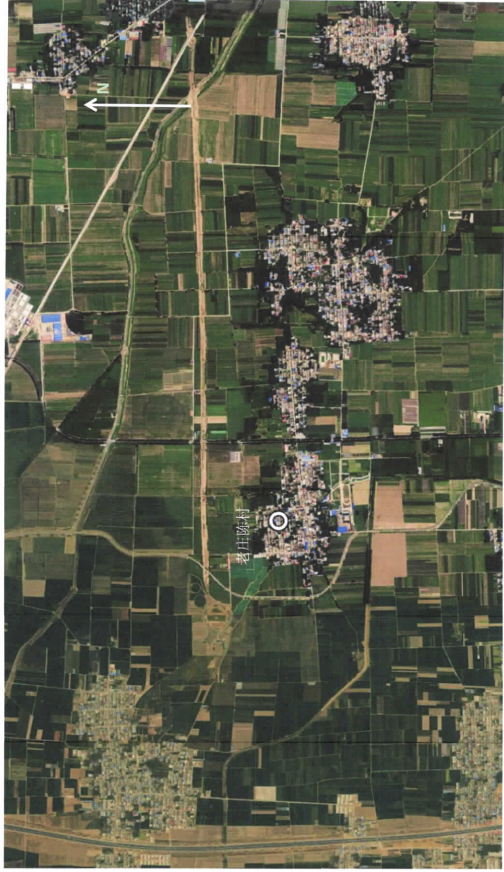
图例：○ 环境空气点位