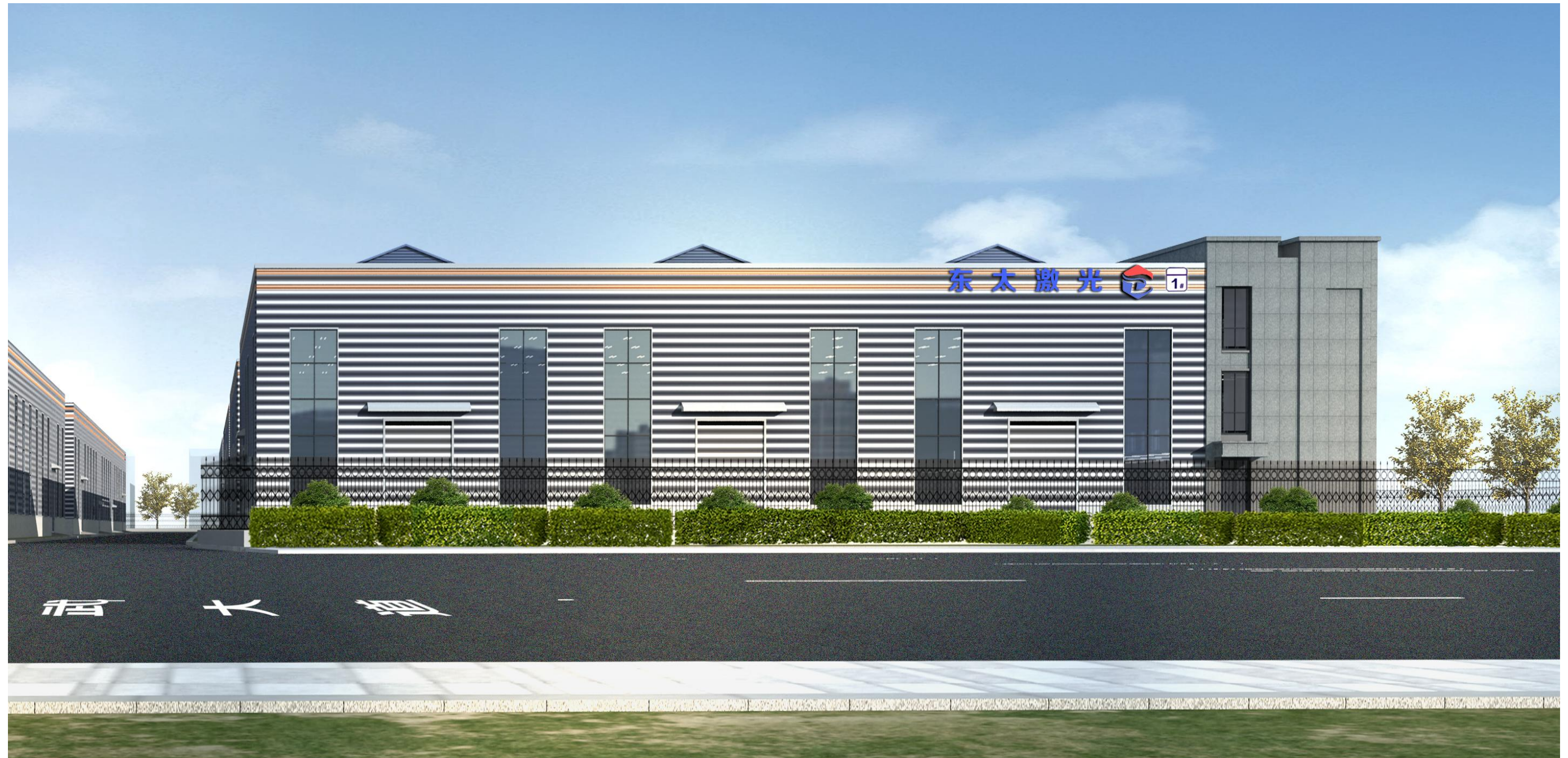
1#-4#车间建筑风格和立面效果基本一致