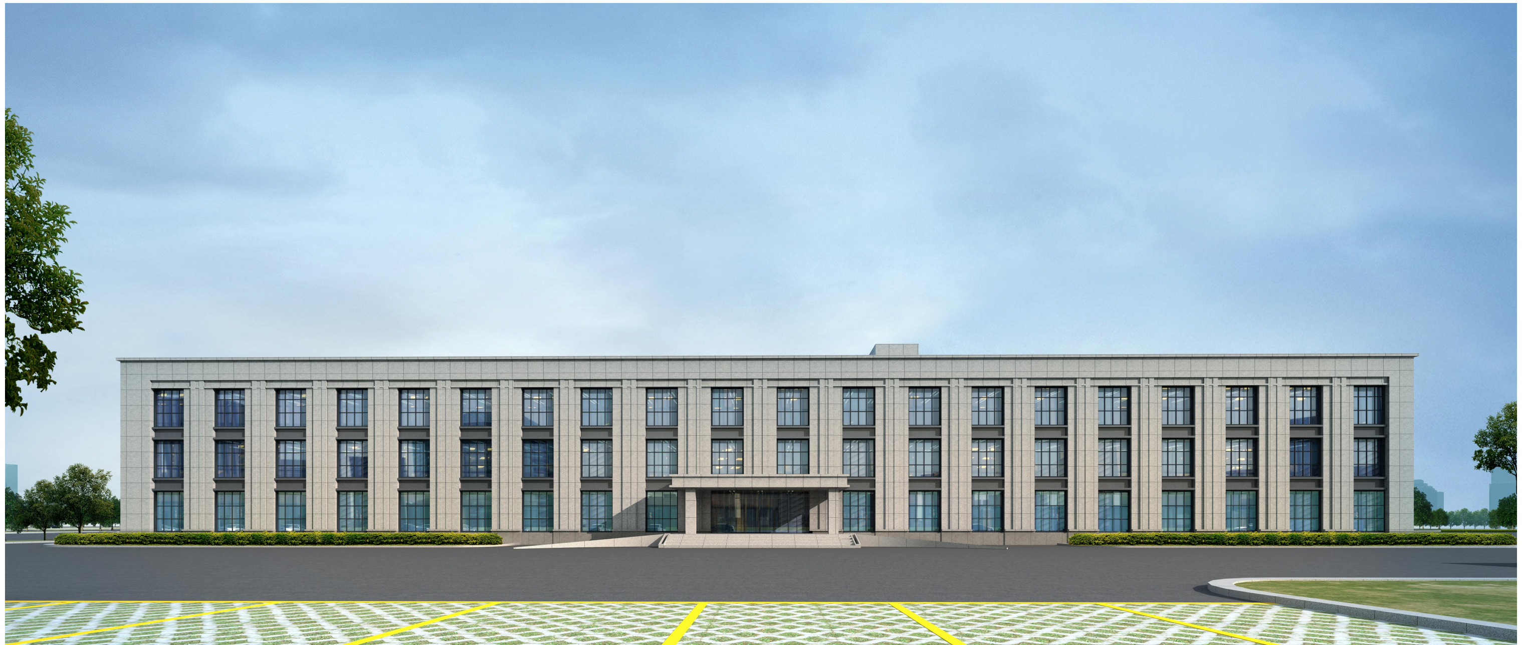
1#办公楼、2#办公楼和2#宿舍楼建筑风格和立面效果基本一致