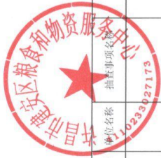
建安区粮食中心随机抽查事项清单（共4项）